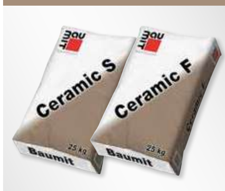
BAUMIT CERAMIC S + F

Adesivo resistente all'acqua e al gelo, per incollaggi flessibili e processo a letto sottile. Per la posa di piastrelle in ceramica e lastre in pietra naturale.