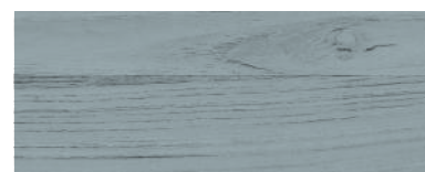
880 BLUETTE TENUE