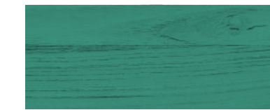
827 VERDE INTENSO

I colori della presente cartella sono riproducibili con i seguenti prodotti: Lignotex, Afradecor, Durolack Seta, Brillspar, Keller Lack 61, Ingham Clark Flattig Trasparente, Ingham Clark Rinnovalegno Protezione Integrale. L'aspetto del legno a lavoro finito è in funzione del prodotto utilizzato e del numero di mani applicate; infatti aumentando le applicazioni il tono di colore tende a divenire più scuro e lucido.