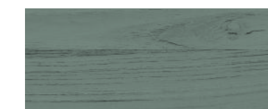
814 GRIS BLU