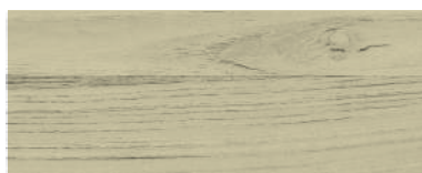
870 SALICE BIANCO