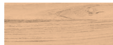
886 ROSA CIPRIA